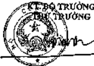
Trung tướng Lê Quốc Hùng